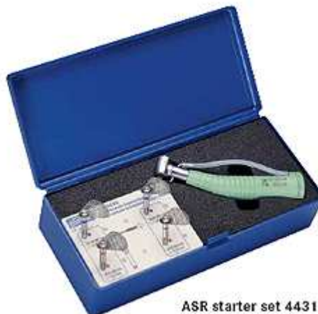
ASR starter set 4431